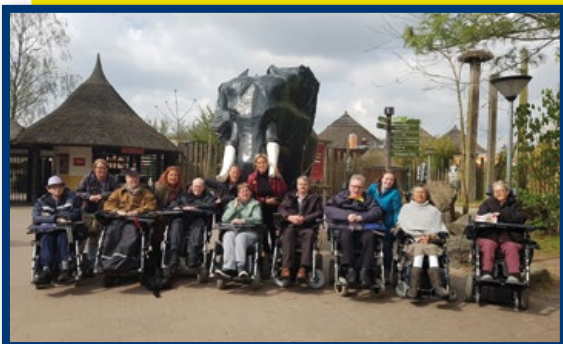
Vervoer voor dagjes uit

In 2021 gaf onze vriendenstichting bijna vijftienhonderd euro uit aan individuele aanvragen van bewoners. Dit betrof aanvragen voor een verblijfsvergunning, huisraad en een feestelijke activiteit voor een jubileum.