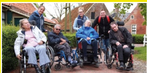
Wat was er veel te zien bij het Zuiderzeemuseum!

Ook dit jaar heeft het Pauwenhof vier gezellige dagen uit georganiseerd voor haar bewoners. Dit jaar stond op het programma: Hoenderdaal Dierentuin (geweldig als de aapjes op je schoot komen zitten!); Strandrups Noordwijk (heerlijk de wind even door je haren en een stuk over het strand rijden); Zuiderzeemuseum (interessant hoe dat er vroeger allemaal aan toe ging) en Bioscoop Beverwijk (lekker lunchen en dan even achterover zakken bij de film). Stichting Vrienden Van heeft het vervoer voor deze week betaald. De week werd afgesloten met een BBQ.