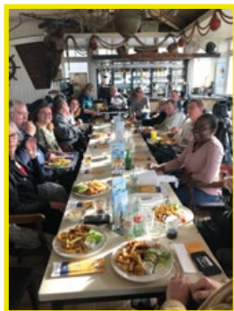
Ook de verzorgenden mochten meesmulen.

Toen we onze diverse hoven vroegen of ze een leuke activiteit voor hun eigen hof wilden bedenken, meldden zich maar liefst vijf voor een uitstapje naar de Blauwe Loper! Het Valken- en Lijster-, Reigers-, Patrijzen- en Meeuwenhof brachten een bezoek aan de Loper en Strandpaviljoen Thalassa. De hoven waren unaniem enthousiast. De bezoeken werden afgesloten met een kibbelingmaaltijd of veganistische hamburger. Vervoer en maaltijd werden aangeboden door Stichting Vrienden.